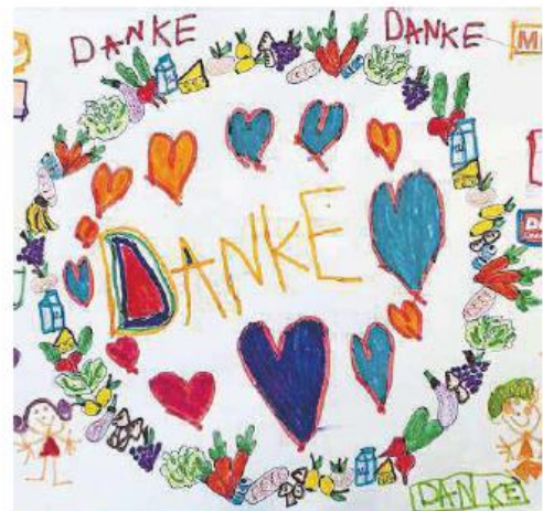
Die Schülerin Laura bedankte sich beim Verkaufspersonal.